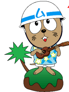
マスコット キャラクター む〜ぼう

※詳細が未定のものもあります。また日時等の変更や中止となる場合があります。あらかじめご了承ください。